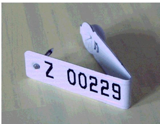
Beispiel eines ausgefüllten Wildursprungsscheines mit zugehöriger Wildmarke

Für weitere Fragen stehen wir Ihnen gern zur Verfügung: