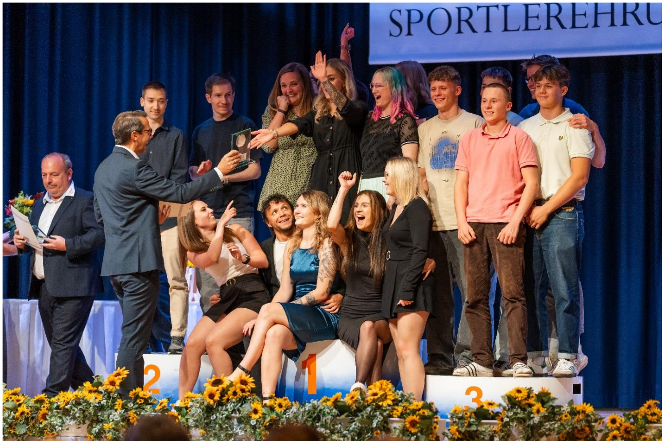
Abbildung 1: Polar1 GmbH