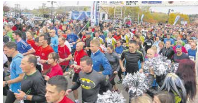
Impressionen vom Herbstlauf 2015

Neben den sportlichen Herausforderungen, u. a. mit Wertungsläufen im Sachsen Cup 2016 und Westsachsen Cup wird gemeinsam mit der Freien Presse auch in diesem Jahr ein „Freie Presse-Firmen-, Vereins- und Familienlauf“ durchgeführt. Hierzu laden die TSG Glauchau e. V. und die Freie Presse Firmen, Institutionen und Vereine sowie Familien ein, sich an diesem Event aktiv sportlich zu beteiligen. Start über die 3,2 Kilometer ist am 30. Oktober 2016, 09:50 Uhr an der Sachsenlandhalle Glauchau. Das Unternehmen stellt ein (oder mehrere) Team(s) mit je drei Läufern. Diese absolvieren jeweils die Strecke. Die Zeiten der drei Aktiven werden addiert und ergeben die Gesamtzeit. Die drei Teams mit der besten Gesamtzeit (unabhängig, ob weiblich-männlich oder gemischt) erhalten Pokale und Urkunden. Alle Teilnehmer bekom-