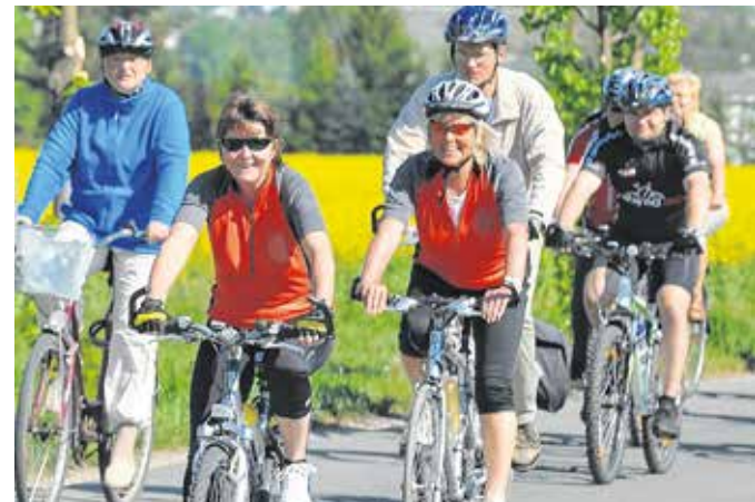
Immer wieder zieht es bei schönem Wetter zahlreiche Radler in die Natur.

Die genauen Teilnahmebedingungen können unter www.mulderadweg.de/fotowettbewerb nachgelesen werden.