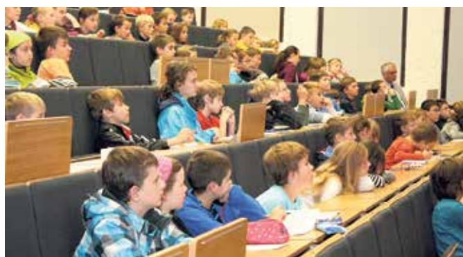
Interessiert hören die Schülerinnen und Schüler den Vorlesungen der Professoren an der WHZ im Rahmen der Kinderuni zu.

Westfälische Hochschule Zwickau Studienwerbung / Öffentlichkeitsarbeit Telefon: 0375 536-1053 E-Mail: Kinderuni@fh-zwickau.de