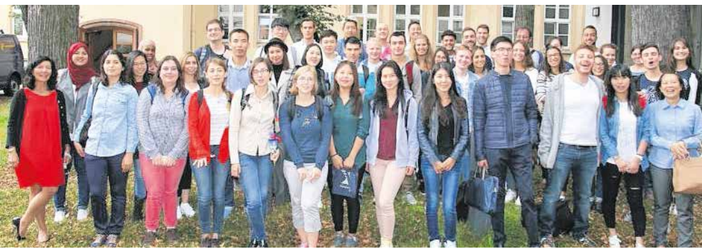
Die Teilnehmer des 10. Deutsch-Intensivkurses

Für etwa 60 junge Menschen aus 14 Ländern startete bereits am 5. September 2016 das Studium an der Westsächsische Hochschule Zwickau (WHZ). In drei Wochen lernen sie intensiv die deutsche Sprache. Am 4. Oktober 2016 beginnen dann auch für sie die regulären Studiengänge. Gleich am ersten Tag finden die Einstufungstests statt, mit denen festgestellt wird, wie gut sie schon deutsch sprechen. Auch Anfänger