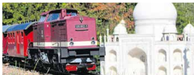
Bereits zum 35. Mal lassen Gartenbahner am 24. und 25. September ihre Züge in der Miniwelt Lichtenstein fahren.